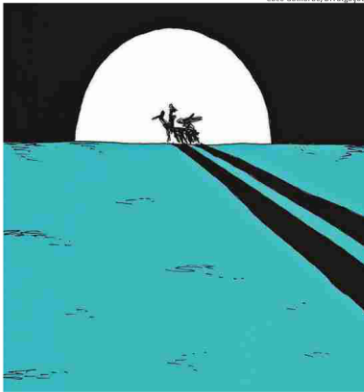
Dom Quixote e Sancho Pança no traço de Caco Galhardo

Além do próprio texto de Cervantes, autor se inspira em ilustrações clássicas, como as de Gustave Doré